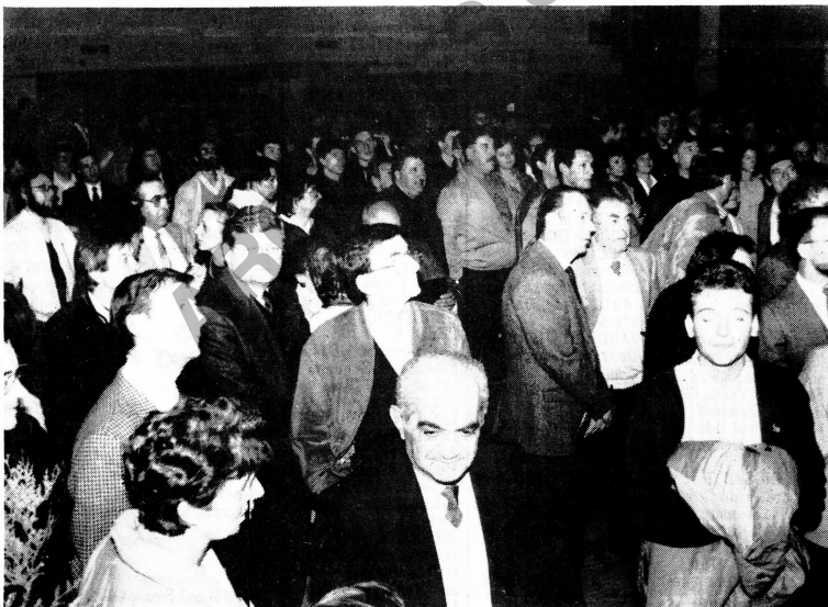
Le foyer culturel bondé lors du dépouillement